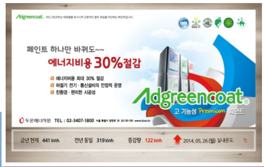
기업홍보 / 공지 화면